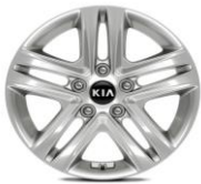
Cerchi in lega da 16" 205/55 R16