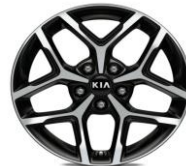
Cerchi in lega da 17" 225/45 R17 GT Line