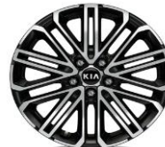
Cerchi in lega da 18" 225/40 R18 GT Line