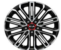
Cerchi in lega da 17" 225/40 R18 GT

Dimensioni (mm) Ceed 5 porte versioni Urban e Business Class