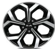
Cerchi in lega da 17" 225/45 R17