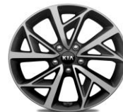
Cerchi in lega da 18" 225/45R18